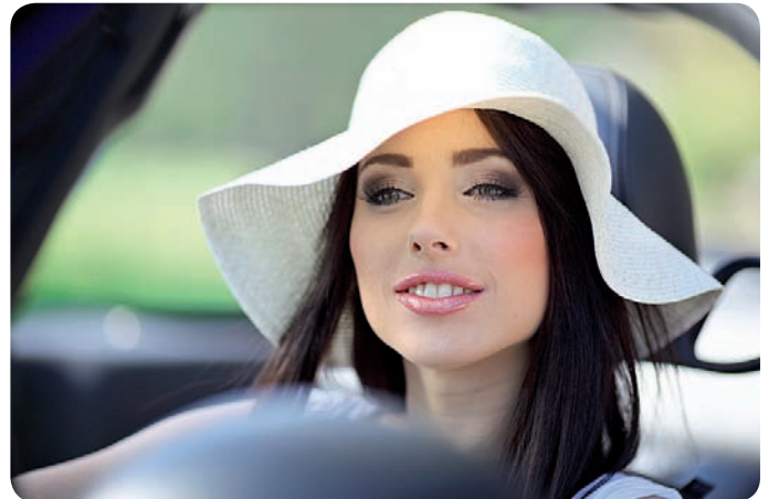
Bleiben Sie unbeschwert – auch nach einem Schaden!

Dank dieser zeitlich unbegrenzten Garantiedauer bleiben Sie noch unbeschwerter und erhalten noch mehr Sicherheit beim Verkauf oder Eintausch Ihres Fahrzeuges.