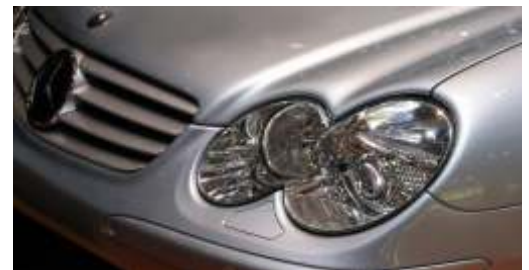
Auch nach Jahren perfekter Glanz - dank Nanotechnologie

Mit unserem von allen relevanten Fahrzeugherstellern homologierten Wasserlacksystem