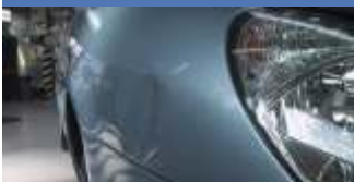
Ärgerlich - ein Schaden am Auto und niemand meldet sich