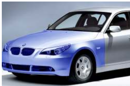
Der Vorbau des neuen BMW Serie 5 ist vollständig aus Aluminium

Die Stahlindustrie hat mittlerweile die Zeichen der Zeit erkannt und bemüht sich intensiv, dünnere Bleche zu produzieren, welche trotzdem eine hohe Festigkeit sicherstellen. Hoch- und höchstfester Stahl kommt bei immer mehr Modellen zum Einsatz.