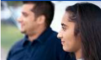
Fahren Sie nie direkt hinter Ihrem Partner

von Stodex sind wir in der Lage, alle Instandstellungen gemäss Werkvorschrift auszuführen. Unser Lacksystem wurde unter anderem auch von MERCEDES-BENZ autorisiert.